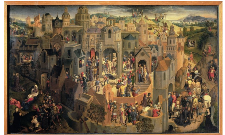
Passione di Cristo dipinto nel 1470 da Hans Memling

Vediamo alcuni esempi, per capire che la via del Calvario non è diversa dalla nostra via, che la via della Croce è anche la via della Luce. Via Crucis, Via Lucis.